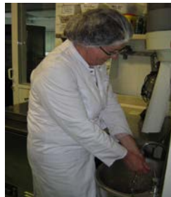
Etape 2 : Enlever bijoux et montre, et nettoyer correctement les mains au lave main à commande non manuelle, équipé de distributeurs de savon et de papier à usage unique