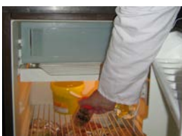
Etape 7 : stocker le/les prélèvements au froid positif entre 0 et +3°C pour les produits frais et pour les denrées congelées au froid négatif ≤ 18°C jusqu'au passage du laboratoire