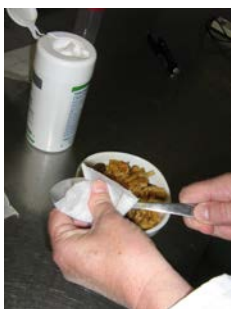
Etape 4 : Désinfecter le matériel de prélèvement à l'aide d'une lingette désinfectante