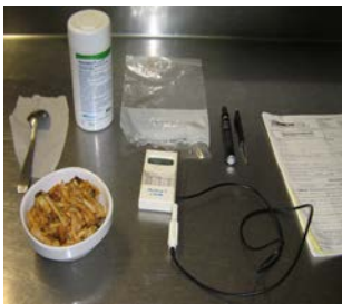
Etape 1 : Préparation du matériel sur un plan de travail nettoyé et désinfecté au préalable