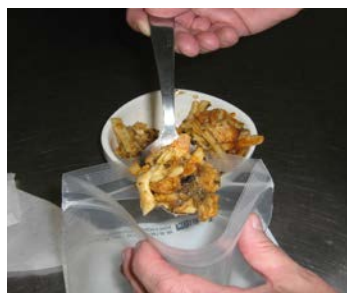
Etape 5 : Prélever 100g ou 200g (Listeria) minimum d'échantillon en prenant soin de ne pas le contaminer (ne pas tousser, ne pas mettre les doigts dans la poche)