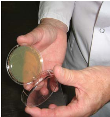
Etape 3 : ouvrir la boîte de surface en prenant soin de garder les doigts sur la partie en plastique et de ne pas contaminer (ne pas tousser ne pas mettre les doigts sur la gélose)

Etape2 : Enlever bijoux et montre et nettoyer correctement les mains au lave main à commande non manuelle, équipé de distributeurs de savon et de papier à usage unique