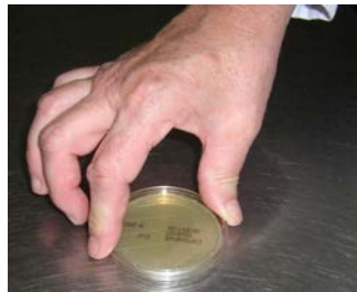
Etape 4 : Appliquer la gélose, sur la surface préparée et maintenir pendant 10 secondes sans bouger. Refermer avec précaution