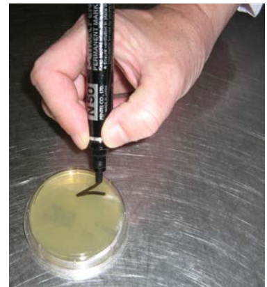
Etape 5 : identifier le prélèvement en indiquant un numéro qui sera reporté sur la demande d'analyse

Etape 6 : Scotcher l'une sur l'autre l'ensemble des boites et conserver au froid positif entre 0°C et +4°C jusqu'au passage du laboratoire.