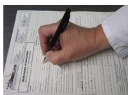
Etape 8 : Compléter le formulaire de demande fourni par le laboratoire