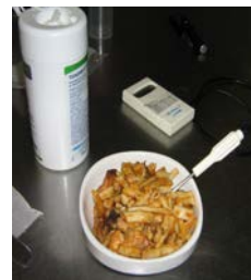
Etape 3 : désinfecter la sonde du thermomètre à l'aide d'une lingette désinfectante et prendre la température de l'échantillon en piquant la sonde au cœur du produit (ne pas employer de thermomètre à laser)