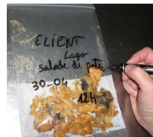
Etape 6 : Identifier clairement sur le contenant, le prélèvement (nom de votre établissement, commune, date, nature de l'échantillon, heure)